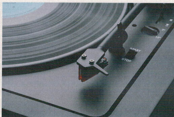
INNOVATION: Der massearme Tonarm ist mit einer Carbon-verstärkten Headshell ausgerüstet. Der MM-Tonabnehmer stammt von Ortofon.

Der Automat A2 hat einen ultraleichten 8,3-Zoll-Aluminium-Tonarm, der an die ULM-Tonarme von Dual erinnert, die der Hersteller Ende der 1970er-Jahre eingeführt hat. Auch die kardanische Tonarmaufhängung kommt Dual-Kennern bekannt vor. Sie ist mit Stahlkugellagern ausgerüstet, die die Reibung minimieren sollen. Unser Testgerät wies keinerlei Lagerspiel auf. Die Auflagekraft wird bei diesem Tonarm nicht, wie bei den meisten anderen, über das Gegengewicht eingestellt. Stattdessen kommt eine präzise Feder zum Einsatz, die eher dem Uhr-