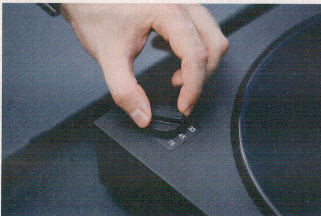
TRADITION: Neben 33,3 und 45 Umdrehungen pro Minute bietet der Automat A2 auch die Schellack-üblichen 78 U/min