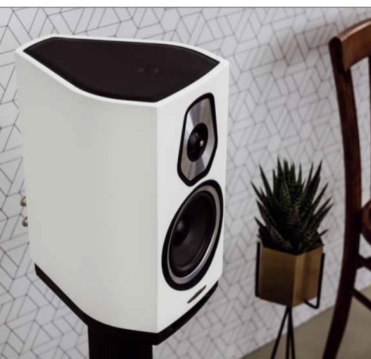
Für die Rear-Lautsprecher Sonetto I (hier die Version in Weiß) gibt es perfekt passende Ständer von Sonus Faber