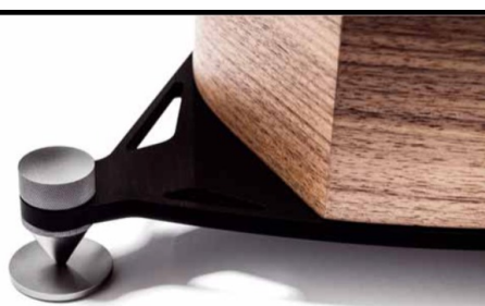
Höhenverstellbare Spikes sorgen für absolut sicheren Stand der Sonetto V

die leichte Verjüngung nach hinten stabilisiert das Gehäuse ganz enorm, stehende Wellen im Inneren werden reduziert und ganz nebenbei sieht diese Form einfach umwerfend elegant aus. Sanfte Rundungen der Gehäusekanten machen die Sonetto zu echten Schmuckstücken, das Walnuss-Echtholz furnier unserer Testmuster ist ansatzlos und perfekt um diese Gehäuserundungen herumgeführt und ist ein Musterbeispiel für wahre Handwerkskunst. Übrigens werden alle Sonetto-Lautsprecher in Norditalien größtenteils von Hand gefertigt und bestehen problemlos jeden noch so akribischen Qualitäts-Check.