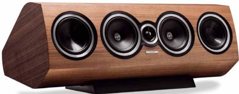
Für etwas mehr Power auf dem Mittenkanal bietet sich optional der größere Sonetto Center II an, in unserem Set kam der kleinere Center I zum Einsatz