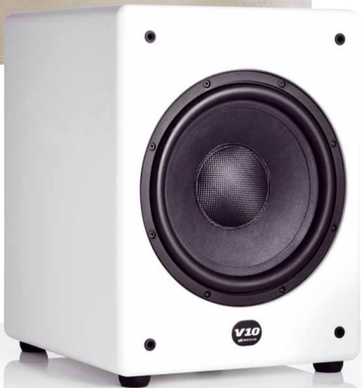
Der kompakte, und dennoch kräftige V10 von M&K Sound ist der passende Tiefton-Spielpartner für das Sonetto-Set

Sonetto-5.1-Set Aus dem Programm der Sonetto-Serie haben wir ein schlagkräftiges Surroundset zusammengestellt. Mit der Sonetto V kommen als Frontsysteme die zweitgrößten Standlautsprecher zum Einsatz, die mit einer Bauhöhe von gut 107 Zentimetern genug Platz für zwei Tieftöner mit 130-mm-Membranen, einem Mitteltöner und einer großen 29-mm-Kalotte bieten. Massive Metallfüße sorgen für sicheren Stand und stellen den nötigen Abstand zum Fußboden sicher, denn auf der Unterseite der Sonetto V befinden sich Bassreflexöffnungen. Als Rearlautsprecher wählen wir mit den Sonetto II die etwa 37 cm hohen Regallautsprecher, die als 2-Wege-Systeme mit jeweils einem 130-mm-Tiefmitteltöner und der 29 mm großen Hochtonkalotte bestückt sind. Beim Center I handelt es sich um den kleineren der beiden Sonetto-Centerlautsprecher, hier arbeiten neben der 29-mm-Kalotte zwei Tiefmitteltöner mit 115-mm-Membran. Eine dazugehörige Bodenplatte sorgt für festen Stand des