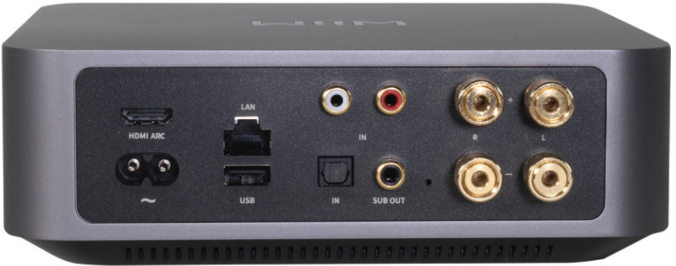
Trotz des kleinen Formfaktors kommt am Anschlussterminal des WiiM Amps einiges unter. So lässt sich auch unser TV anschließen und hochauflösender Fernsehkonsum genießen

rendes Design, mächtige Appsteuerung und eine erstaunliche Qualität. WiiM vermag also ein benutzerfreundliches, wirkungsvolles Multi Room-Setup zu realisieren. Doch nun zurück zum WiiM Amp.