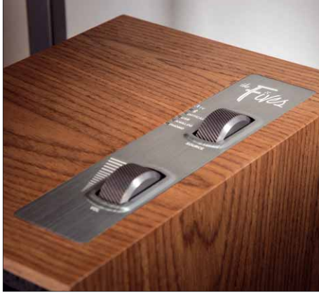
Griffige Drehregler auf der Lautsprecher-Oberseite erleichtern die Bedienung direkt am Lautsprecher

Labor und Praxis Unsere Labormessung bringt die erstaunlich linearen und neutralen Eigenschaften der „The Fives“ zu Tage. Praktisch über den gesamten musikalisch wichtigen Frequenzbereich spielen die Klipsch-Lautsprecher sehr ausgewogen, auch unter Winkeln bis zu 30° sind keine Peaks oder Eintrübe im Frequenzgang zu erkennen. Die Basswiedergabe erstreckt sich bis etwa 60 Hertz – nicht schlecht für Lautsprecher mit kompakten Abmessungen. Ebenfalls können die „The Fives“ mit niedrigen Verzerrungen, einem hohen Dynamikumfang und bestem Impulsverhalten glänzen. Im gemessenen Zerfallsspektrum sind praktisch keinerlei Resonanzen oberhalb 800 Hertz zu entdecken. Auch im Hörtest zeigen sich die beiden Klipsch-Lautsprecher von Ihrer Schokoladenseite und liefern eine erstklassige, musikalische Vorstellung. Klipsch-typisch glänzen die „The Fives“ mit lebhaften, dynamischen