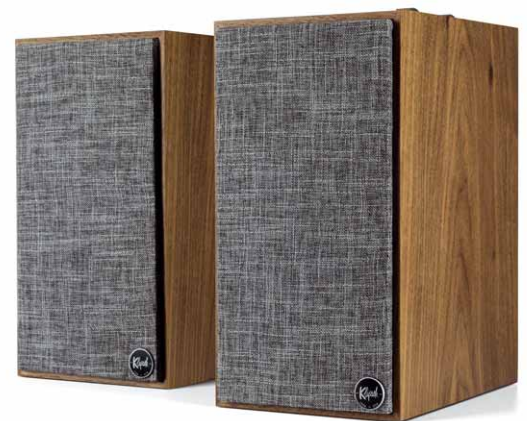
Dezentes Retro-Design dank Echtholz-Oberflächen und optionalem Schutzgitter mit grau melierter Stoffbespannung