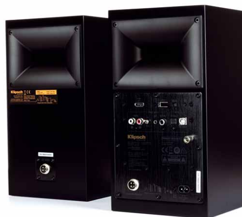
Master-Slave-Konzept: In der aktiven Box eines Paares „The Fives“ stecken vier Endstufen und reichhaltige Anschlussmöglichkeiten

zudem zu einem echten Vergnügen, denn große, griffige Drehregler auf der Oberseite der „Master-Box“ erlauben die simple Auswahl der gewünschten Musikquelle sowie die Einstellung der Lautstärke. Alternativ steht eine kleine Fernbedienung zur Verfügung, mit der sich sämtliche Funktionen der „The Fives“ bequem vom Hörplatz aus steuern lassen. Sollte die dezente Basswiedergabe der kompakten Regallautsprecher mal nicht ausreichen, lässt sich dank Subwoofer-Out bei Bedarf ein zusätzlicher, aktiver Subwoofer per Cinch-Kabel anschließen und in der Lautstärke individuell per Fernbedienung der „The Fives“ regeln. Da sich in der „Masterbox“ die gesamte Elektronik inklusive der vier Endstufen befindet, wird mittels eines mitgeliefertem Systemkabel die passive „Slave-Box“ angeschlossen. Mit einer Länge von rund 5 Metern sollte dieses Kabel in der Praxis absolut ausreichen.