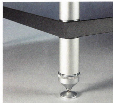
▲ Durchdachtes Baukastenprinzip: Die Rohre sind auch nachträglich austauschbar und füllbar.

Die Trend Line wird neben den bekannten sechs Ausführungen, jetzt auch in fünf Hochglanz-Versionen angeboten. Diese Beschichtung ist laut Creaktiv extrem kratzfest und säurebeständig, wird also auch von Gerätefüßen nicht angegriffen.