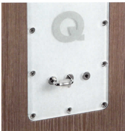
▲ Mit dem Drahtbügel lässt sich der Hochtöner um +/- ein halbes Dezibel anpassen.