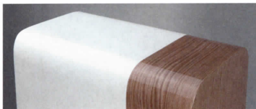
▲ Das Gehäuse sieht mit seiner zweigeteilten Farbgebung sehr wertig aus.