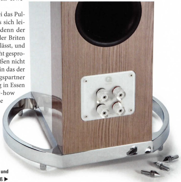
Äußerst gelungen in Optik und Funktion: der Standfuß ►

die Serienproduktion der Boxen um rund ein Jahr verzögerte. Die zweilagige Gekämpfung zwischen den drei einzelnen MDF-Schichten des Gehäuses arbeitet nicht nur höchst wirkungsvoll, sondern ist in Kombination mit den anderen Maßnahmen zur Gehäuseberuhigung auch produktionstechnisch höchst anspruchsvoll. Um die Qualität der Chassis zur Geltung zu bringen, musste man zur Ruhigstellung des Gehäuses bei unterschiedlichsten Frequenzen eine ganze Armada von Maßnahmen ergreifen. Eine Aufgabe, die ohne modernste Messmethoden nicht zu leisten wäre. Neben Messungen per Laser-Interferometer wurde in Essen auch fleißig geklippelt. Dort hatte man stets vor Augen, dass wir es hier nicht mit einem „cost-no-object“-Lautsprecher zu tun haben, sondern mit einem Großserienprodukt mit vergleichsweise kleinem Preisschild, und ersann Möglichkeiten, an neuralgischen Punkten wirkungsvoll, aber kosteneffizient das Gehäuse von Eigengeräuschen als Folge von Vibrationen zu befreien. Den letzten entscheidenden