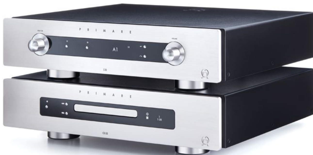
Primare Vollverstärker I35 DAC + CD35