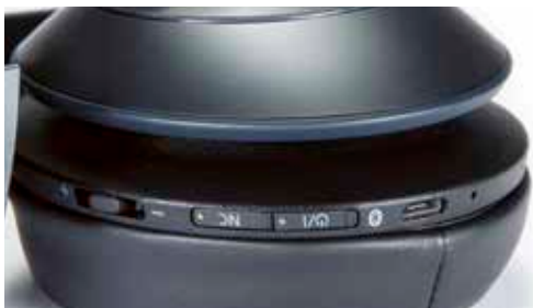
Das Pairing lässt sich beim Technics nicht ganz intuitiv bedienen.

Mit rund 20 Stunden ununterbrochener Laufzeit liegt der Technics am unteren Ende des Teilnehmerfeldes, auch die Ladezeit mit etwa vier Stunden ist bestenfalls durchschnittlich. Erfreulich niedrig ist die Impedanz von 28 Ohm, die allerdings nur beim drahtgebundenen Betrieb von Bedeutung ist. Die weichen Ohrpolster sind austauschbar, der Bügel in vielen kleinen Raststufen verstellbar. Allerdings hat man bei Technics an der Polsterung des Bügels den Rotstift etwas zu intensiv sein Werk verrichten lassen, das hätten wir uns gern etwas weicher gewünscht. Letztlich ist der Tragekomfort aber doch als sehr angenehm einzustufen, weil das Gewicht gleichmäßig verteilt und der Anpressdruck ans Ohr so bemessen ist, dass auch längere