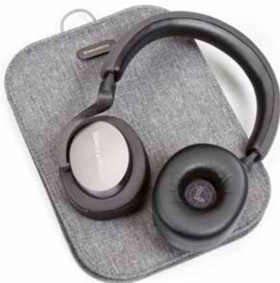
Feines Täschchen für Hörer und Zubehör, edle Verarbeitung und klare Links/Rechts-Kennzeichnung

Musikalisch ließ sich der PX5 nicht die Butter vom Brot nehmen