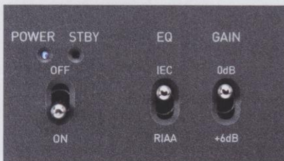
▲ Kippschalter zum Einschalten, zur Entzerrungswahl und zur Anpassung an sehr leise MC-Tonabnehmer.

STICHWORT Clipping: Übersteuerung der Verstärkerstufe durch eine zu hohe Spannung des Eingangssignals, die zu Verzerrungen führt.